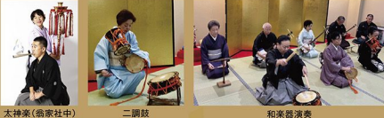
太神楽(翁家社中) 二調鼓 和楽器演奏

10:00(15分) 開会式 10:30(30分) 太神楽ステージ① 11:15(30分) 女木遣り 二調鼓 和楽器演奏 12:00(30分) 商店街PRタイム 12:45(30分) 落語 三遊亭遊七 13:30(30分) 太神楽ステージ② 14:15(30分) 落語 春風亭昇羊